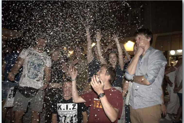
Karneval in Castelsardo